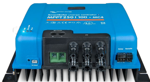
Controlador de carga SmartSolar MPPT 250/100-MC4 Sin pantalla