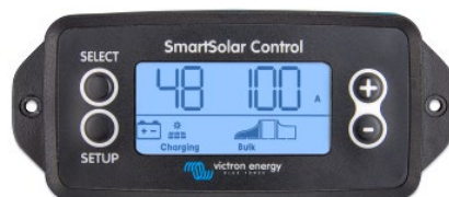
Pantalla enchufable SmartSolar