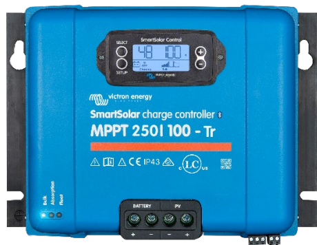
Controlador de carga SmartSolar MPPT 250/100-Tr Con pantalla conectable opcional.